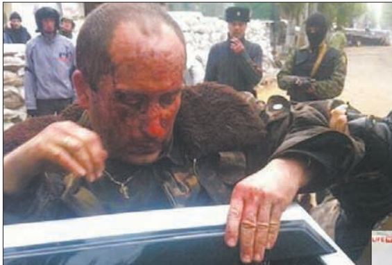
Головний пропагандистський канал країни-агресора передає інформацію про полон українського вертолітника, який вижив у авіакатастрофі

– Я сподівався, що хтось, окрім мене, вижив, тому першим ділом поповз до збитого вертольота. Якби знав, що весь екіпаж загинув, я б одразу кинувся тікати в поле чи кудись ховатись. Я оглянувся по сторонах, нікого не було. Від того місця,